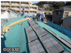
中区A邸 新築コロニアル・クアッド施工中