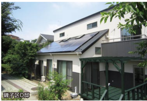
磯子区O邸 新築工事完成