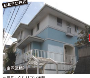
金沢区邸 セラミックシリコン塗装