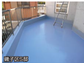
磯子区S邸 屋上防水 ガイナ塗装工事