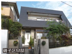
磯子区M邸 特殊形状屋根完成